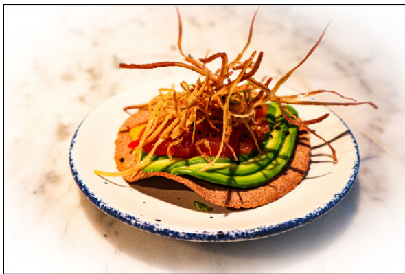
GEMS 田町 1階 Modern Mexican CABOS 「長崎県産本マグロを使ったトスターダ」