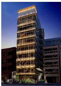
『GEMS 六本木』 2021年11月開業