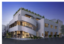
『GEMS AOYAMA CROSS』 2020年9月開業