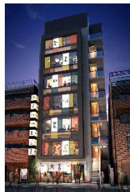
『GEMS 中目黒』 2021年4月開業