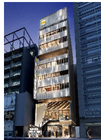
『GEMS 川崎』 2021年3月開業