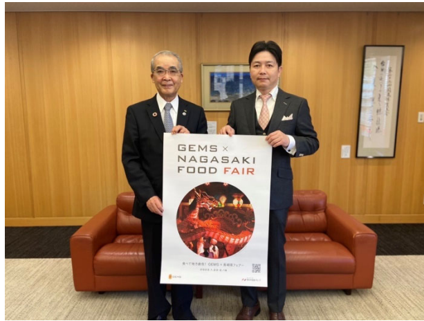
左側：中村法道様(前長崎県知事) 右側：小島達也(前野村不動産コマース社長)

長崎県と連携し、長崎の魅力あふれる食材を使ったメニューをお客様に味わっていただく、食べて地方創生「GEMS×長崎フェア」は、GEMS12棟 計75店舗において、1月22日(土)～2月18日(金)の期間で実施いたしました。