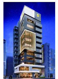
『GEMS 栄』 2019年11月開業