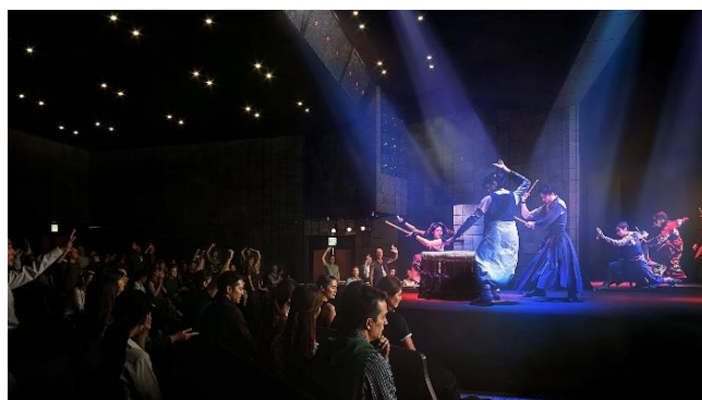
【ホール イメージパース】