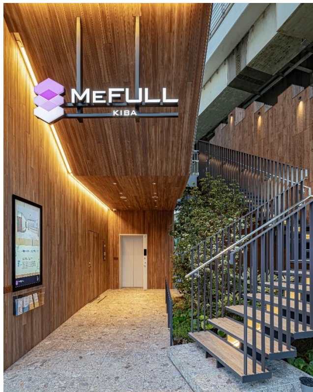
『MEFULL 木場』エントランス