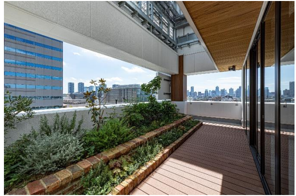
9Fバルコニーガーデン