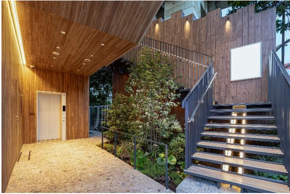
木を基調としたエントランス

江戸時代から昭和にかけて、江戸・東京へ材木を供給し「材木のまち」として栄えてきた木場。「MEFULL 木場」ではエントランス部・基壇部において木を活かしたデザインを採用し、「材木のまち」として栄えた木場地域に溶け込む施設づくりを行っております。当施設では共用部外装の一部に国産材および多摩産材のスギ材を活用し、「木の街並み創出事業」として公益財団法人東京都農林水産振興財団に認定され、支援を受けております。