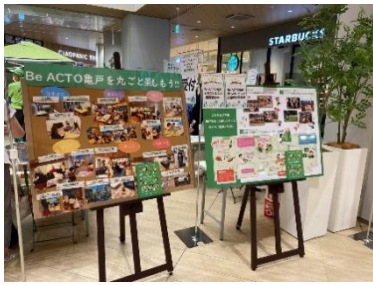
「Be ACTO マルシェ」

カメイドクロック 1F カメクロコートで実施した「Be ACTO マルシェ」には 1,000 名以上の方にご来場いただきました。また、会員様向けのイベントとして、カメクロスステージ周辺の広場や植栽を家族で探索する「親子で一緒にネイチャービンゴ」を実施し、参加された方からは「初めて庭園の草花をじっくり観察する機会になった」などのお声をいただきました。