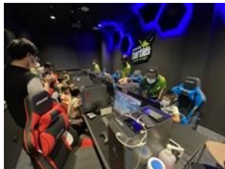
お客様を巻き込んだ無料体験会

カメイドタートルズメンバー主導による、e スポーツ大会。カメクロコートにある大型ビジョンを活用し、大学生限定の大会や一般お客様参加型のイベントを実施