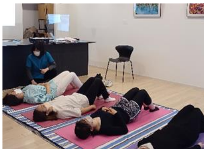
「産前産後の骨盤ケア」

一般社団法人 ACTO 亀戸の事務局を担う、一般社団法人 ママリングスにご協力いただき、子育て相談会や産前産後の骨盤ケアクラスなどを定期開催しています。理学療法士による産後ケアの実践や、いつでも子育て相談ができる「保活」「乳幼児の子育てのお悩みごと」をなんでも何う相談会の実施をしています。相談員は、子育て講座講師や、保育士、ベビーシッターなどの区内の先輩ママさんです。「ちょっとした愚痴も聞いてもらえて安心した」「保育園の手続き前に、気軽に保育園の相談ができて安心した」などのお声をいただいています。