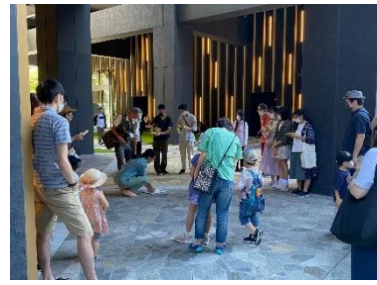
「親子で一緒にネイチャービンゴ」