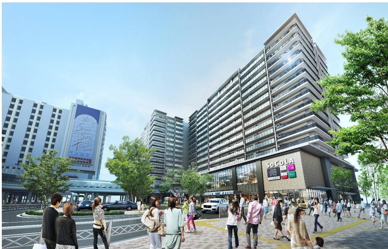
本施設を駅側から望む

再開発を通じて、塚口駅南口は商業集積地として賑わい、塚口さんさんタウンは地域のランドマークのひとつとして市民の皆さまに親しまれていましたが、商業競争環境の変化による空室の増加や旧耐震基準の建物であることへの懸念等から、2014年に区分所有者により「塚口さんさんタウン 3 番館」を建て替える方針が決定されました。2015年の当社参画以降、尼崎市とともに歩行空間の改修など駅前広場の環境整備にも着手し、今般本施設の開業をすることとなりました。