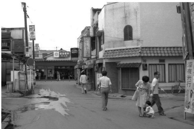
再開発前の塚口駅南口（1975年撮影、出典：Web版 図説 尼崎の歴史）

SoCoLA 塚口クロスが位置する、阪急神戸線・伊丹線塚口駅南口は、尼崎市初の第一種市街地再開発事業（1971年 都市計画決定告示、1978年 事業完了）として整備されたエリアです。戦前より環境の良い住宅地として発展していましたが、尼崎市北部の玄関口にふさわしい街づくりを目指して再開発が実施され、駅前広場をはじめとした公共施設の整備と、塚口さんさんタウン 1 番館・2 番館・3 番館の 3 棟の開発がなされました。