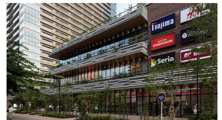
「SoCoLA 武蔵小金井クロス」