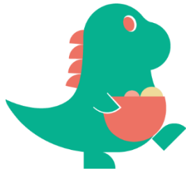
<キャラクター かいじゅうソコラ>

「SoCoLA」とは、“ すぐそこにある COMMUNITY LAND ”を集約した造語。「ちょっとソコラでお買い物」といった誰もが言葉に出しやすい親しみやすさも含まれています。また、親しみやすく愛される商業施設になりたいという思いの象徴として生まれたマスコットキャラクターを、施設の内装、チラシや WEB サイト、その他各種広告等のプロモーション活動に登場させていきます。