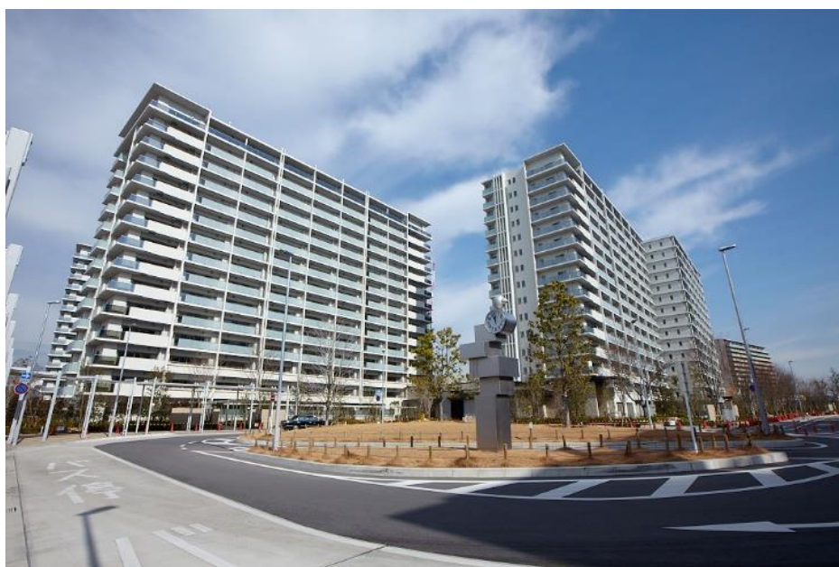
ZUTTO CITY 内、プラウドシティ塚口の様子

なお、同プロジェクトは同コミュニティにおける省エネの取組みや、地域通貨ポイントの取組みが評価され、尼崎市による「尼崎版スマートコミュニティ」に認定されており、また、2018 年、グッドデザイン賞に選ばれております。