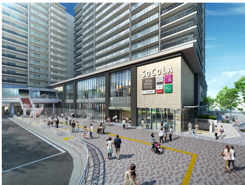
本施設を駅側から望む

なお本施設では、大阪梅田・西宮北口・神戸三宮などの周辺都心部に近く便利な街「塚口」におけるコミュニティの起点として、街づくりへの貢献に取り組みとともに、尼崎市の推進している「居心地がよく歩きたくなる駅前空間創出事業」とも連携し、塚口駅前広場の公共空間利活用による賑わい創出を図ってまいります。