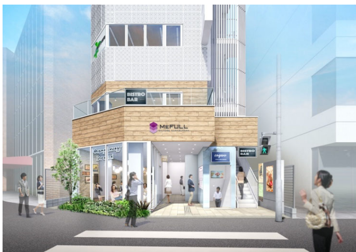
『MEFULL 千歳烏山』エントランスイメージ